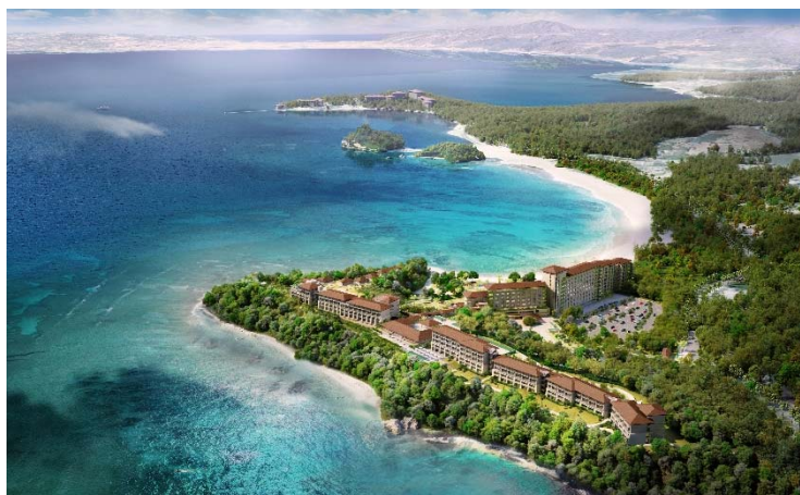
完成予想図(鳥瞰パース)